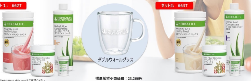
ダブルウォールグラス